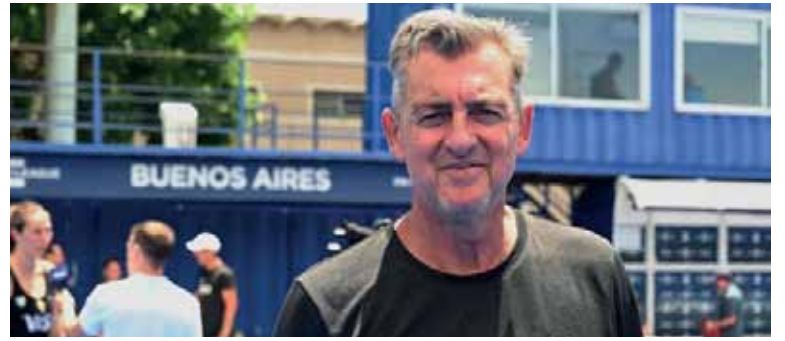
Sondeo. Ferrara evaluará el potencial del equipo.

Disputarán la segunda ventana del torneo en Hobart, frente a Irlanda y Australia durante febrero.