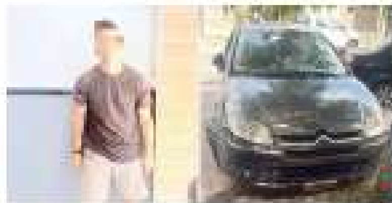
El joven, al momento de ser atropellado por el auto.

El joven, de 20 años, fue atropellado por un auto de la policía de San Justo, lo que provocó su muerte.