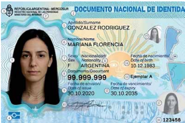
Cambios. Los nuevos DNI que serán entregados desde el mes de febrero.

El cambio más importante está en el soporte material del