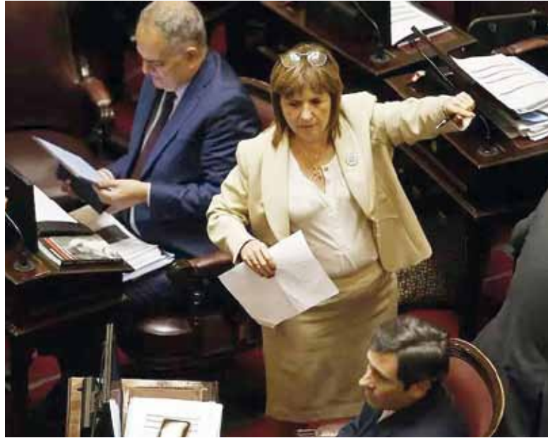
Negociación. Bullrich no logra convencer a Caputo de bajar Ganancias.

Hay quienes deben negociar con los distintos actores, como el ministro del Interior, Diego Santilli, que debe receptor los reclamos de los mandatarios provinciales y ofrecer limitadas soluciones para acumular respaldos que le per-