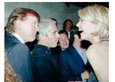
En el archivo. Aparece Donald Trump.

El presidente Donald Trump firmó el proyecto de ley al día siguiente. A partir del 19 de diciembre, fecha límite establecida por ley, el departamento comenzó a publicar