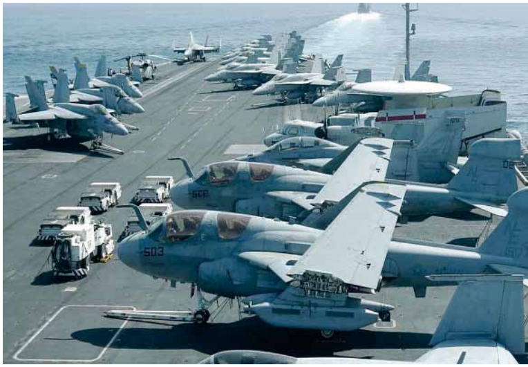
Intimidación. Estados Unidos presiona a Irán para llegar a un acuerdo.

El jueves, Trump dijo que estaba buscando un acuerdo con el go-