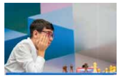
Valioso. “Fausti” volvió al triunfo.

Con un Elo de 2.516, Oro superó a un rival experimentado de 2.604