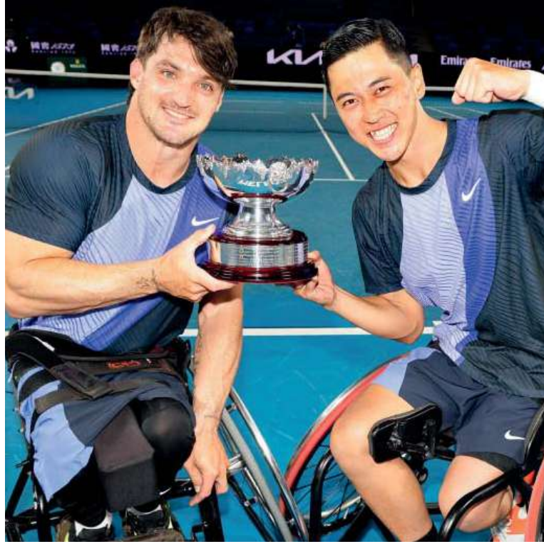
¡Salud! Los campeones posan con el trofeo.

La jornada tuvo un condimento especial: horas antes de la final de dobles, Fernández se enfrentó a su compañero Tokito Oda en las semifinales de singles. Allí el triun-