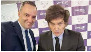
Manuel Adorni y Javier Milei.

El jefe de Gabinete, Manuel Adorni, asumirá en el Directorio de YPF en representación del Estado Nacional, informó la empresa a la Comisión Nacional de Valores.