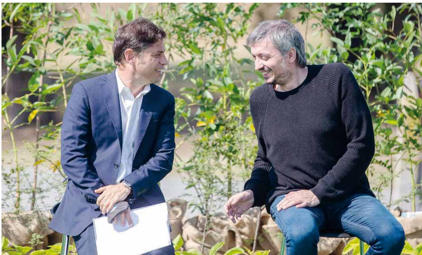
■ Máximo Kirchner busca un acercamiento al Gobernador antes de marzo.

dores. La determinación de no ceder parece ser la posición mayoritaria de gran parte del círculo más cercano a Milei. El tema estuvo presente durante el intercambio de mesa chica de ayer, aunque hasta ahora no hay definición. Página 2